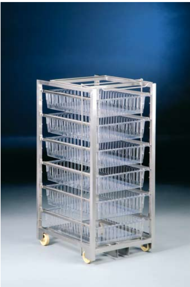
EGISO1 mit 6 Paar U-Schienen CESU60