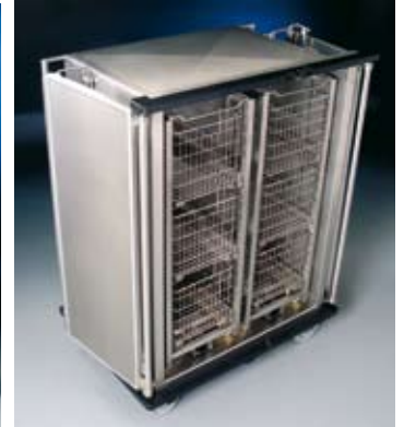
RGEE2x3SH, 2 x EGSTE3E60