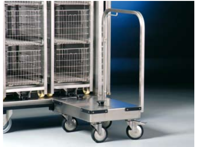
RGEE2x3SH, 2 x EGSTE3E60, UEWSTE3