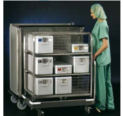
... heranschwenken, bis er selbstständig einrastet.