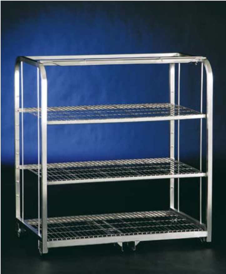
EGSTE9 mit 2 Fachböden CEGSTE9