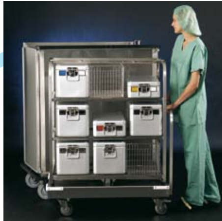
... bis zum Anschlag heranfahren...