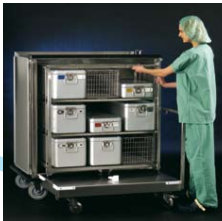
... und einschieben ...