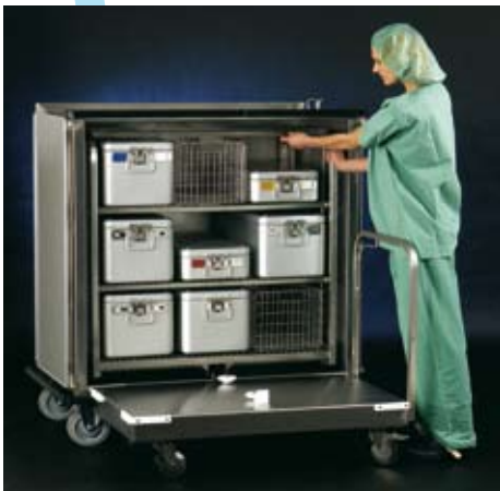
... bis es einrastet.

Ohne Platzwechsel des Bedieners kann das Einschubgestell direkt nach dem Andocken eingeschoben werden: