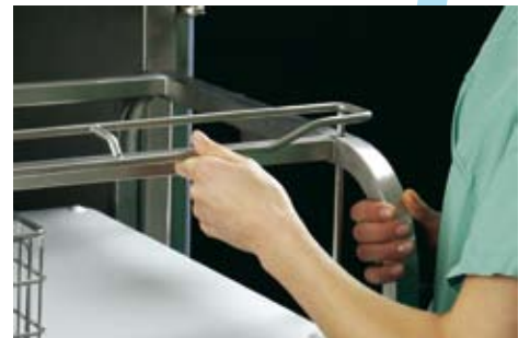
Einfach den Entriegelungsbügel anheben ...