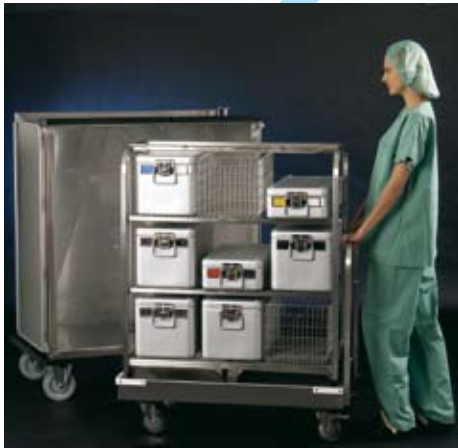
Schräg an den Transportwagen...

Der Übernahmewagen wird mit einem 2-Punkt-Koppelmechanismus einfach und sicher am Shuttle-Transportwagen fixiert (Patent DBP DE 103 17 290).