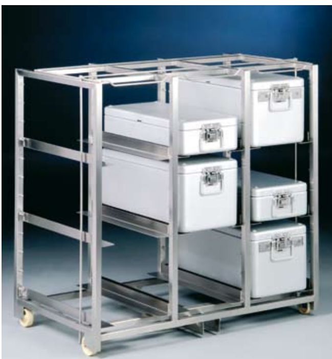
EGSTE9E60 mit 9 Paar Winkelschienen CES60